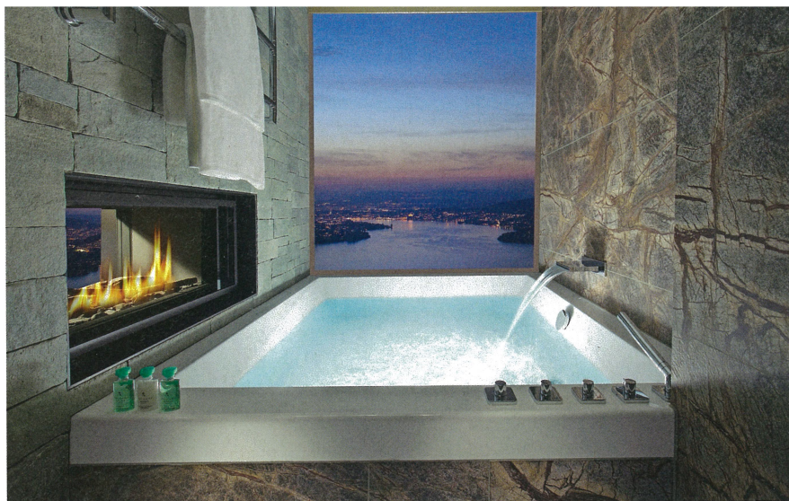
Ein nahezu rahmenloses Fenster ermöglicht den Ausblick auch während des Bades.