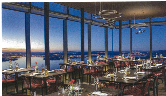
Gastronomie mit Blick auf den Vierwaldstättersee.

sowie ein Restaurant, einen Ballsaal und eine Bar mit herrlichem Blick auf den Vierwaldstättersee. Der gläserne Empfangsbereich, in dem sich Lobby, Bar und Lounge befinden, ist der ideale Ort für Veranstaltungen und Events aller Art – mit eindrucksvoller Kulisse.