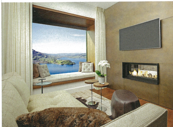
Großzügige Fensterelemente mit einem als Sitzfläche dienendem Rahmen.