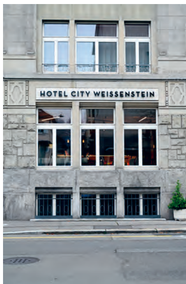
Im einstigen Stickereigeschäftshaus von 1911 empfängt das neue Boutique-Hotel seine Gäste.

Wegen der Pandemie hat die Sorell-Gruppe nach dieser jüngsten Eröffnung eine längere Investitionsphase jäh stoppen müssen. Das auf Stadthotels spezialisierte Unternehmen wurde besonders hart von der Krise getroffen, da von allen Tourismuszweigen der Städtetourismus mit Abstand am stärksten eingebrochen ist. In Zürich mussten dieses Jahr mehrere Häuser schliessen, allerdings