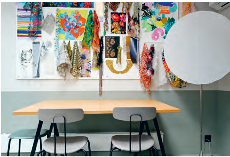
Ein grosser Holztisch bietet – anders als für diese Preisklasse gewohnt – viel Platz.