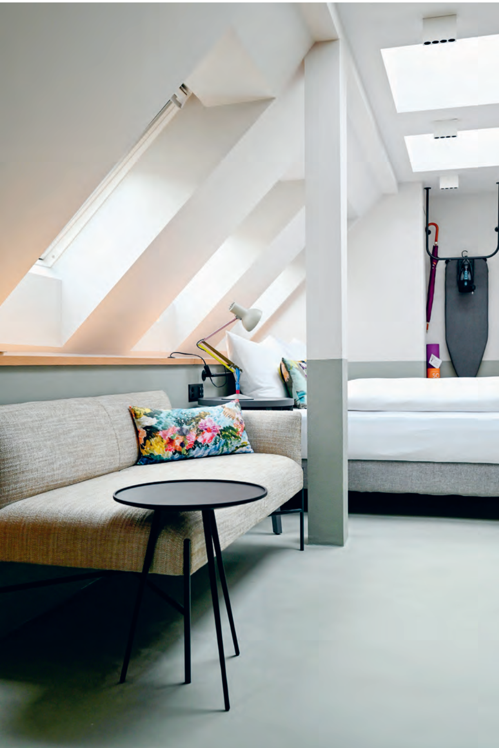
Grau angesetzt: Mit einem einfachen farblichen Trick gewinnen die Suiten unter dem Dach optisch an Höhe.