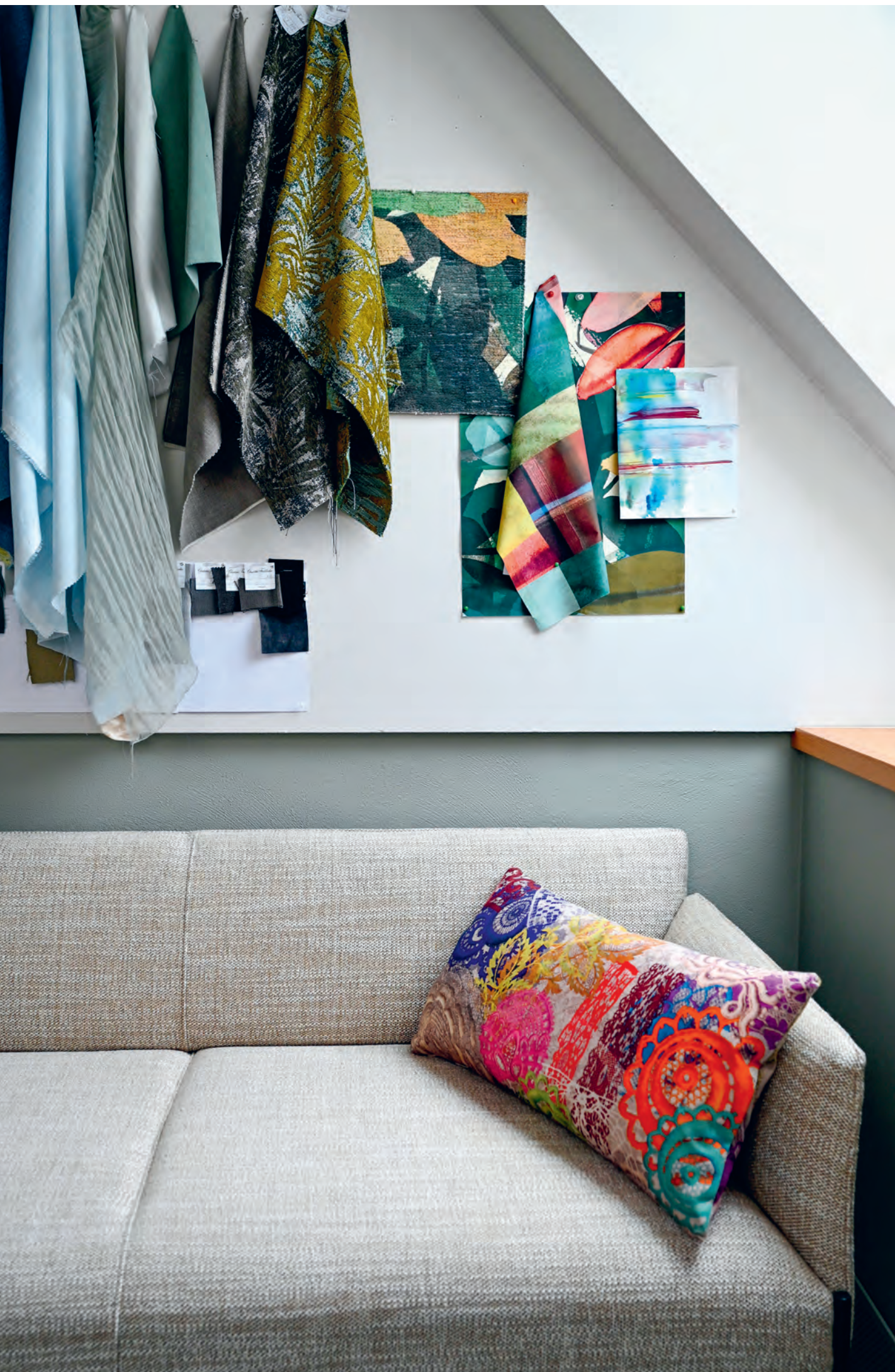
Anfassen erwünscht: Die Interieurs des Hotel City Weissenstein huldigen der Textilstadt St. Gallen.