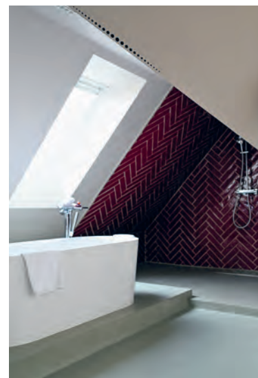
Die Badezimmer unter dem Dach erinnern an private Loftwohnungen.