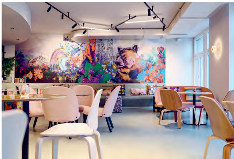
Die Lobby mit buntem Wandbild ist der einzige Gemeinschaftsraum des Hauses.

keines der Sorell-Gruppe. Die aktuelle Situation sei aber eine grosse Herausforderung, bestätigt Andreas Hochstrasser vom ZFV. Viele Projekte, wie beispielsweise der Neubau des Aarauerhofs in Aarau, der mit dem Bieler Architekturbüro :mlzd vorangetrieben wurde, sind sistiert. Ende Jahr stand das Gebäude zum Verkauf. Es gehe jetzt darum, «sämtliche Häuser auf ihre Lage oder Positionierung zu prüfen», so Hochstrasser. Die Geschichte der einzelnen Hotels und deren «Storytelling» sei nämlich noch nicht ausgeschöpft. Hier gebe es noch Profilierungsmöglichkeiten. – Mit den mutigen Bürgerfrauen im Geiste und der über 125-jährigen Geschichte des ZFV im Rücken, die immer wieder auch von Krisen geprägt war, bleibt zu hoffen, dass das Unternehmen auch diese Phase meistert. ●