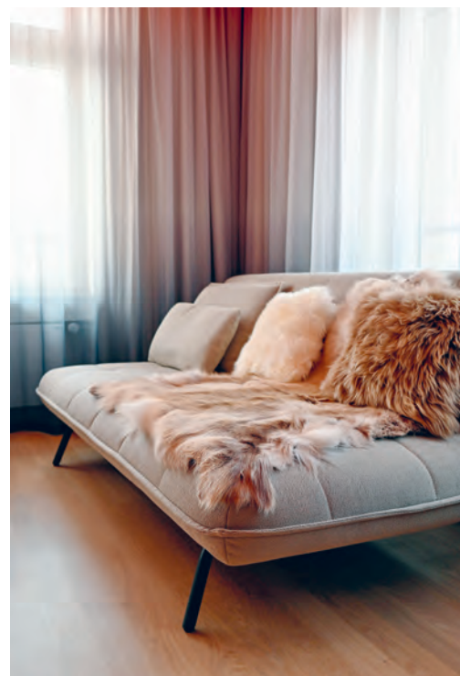
Plaid, Vorhänge, Polsterstoff: Textilien in den unterschiedlichsten Funktionen schaffen die behagliche Stimmung der Räume.