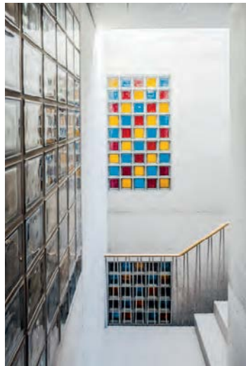
Farbige Glasbausteine im Treppenhaus.