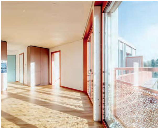
Schattenspiel im Wohnraum durch das ornamentale Geländer.