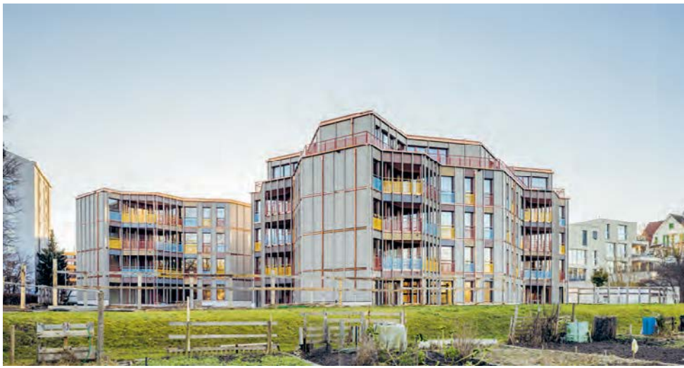
Das Projekt «Wolkengespräch» in Zürich-Affoltern, von Norden betrachtet.