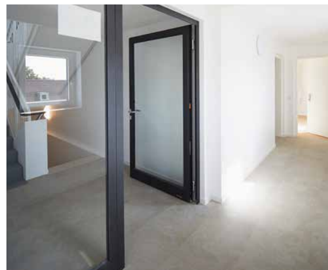
JEAN-LUC VALENTIN, SKYCAMERA 2019

Unter folgendem Link finden Sie einen Beitrag des ZDF über das Bauprojekt: www.zdf.de/gesellschaft/plan-b/plan-b-bezahlbares-zuhause-100.html