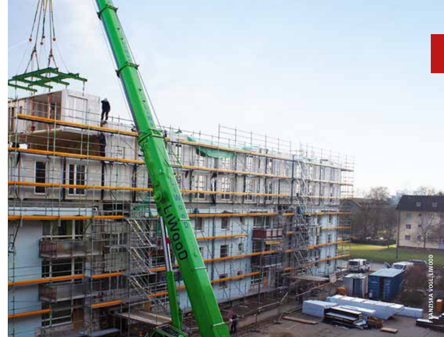
FRANZISKA VOGEL, LIWOOD