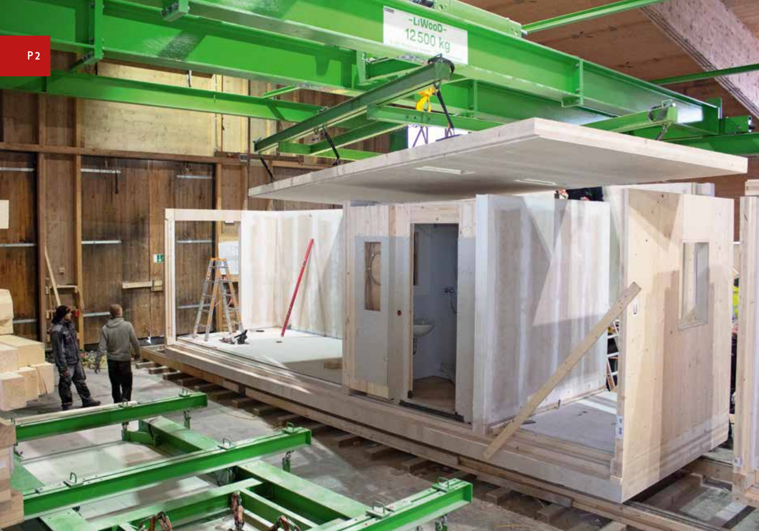
FRANZISKA VOGEL, LIWOOD