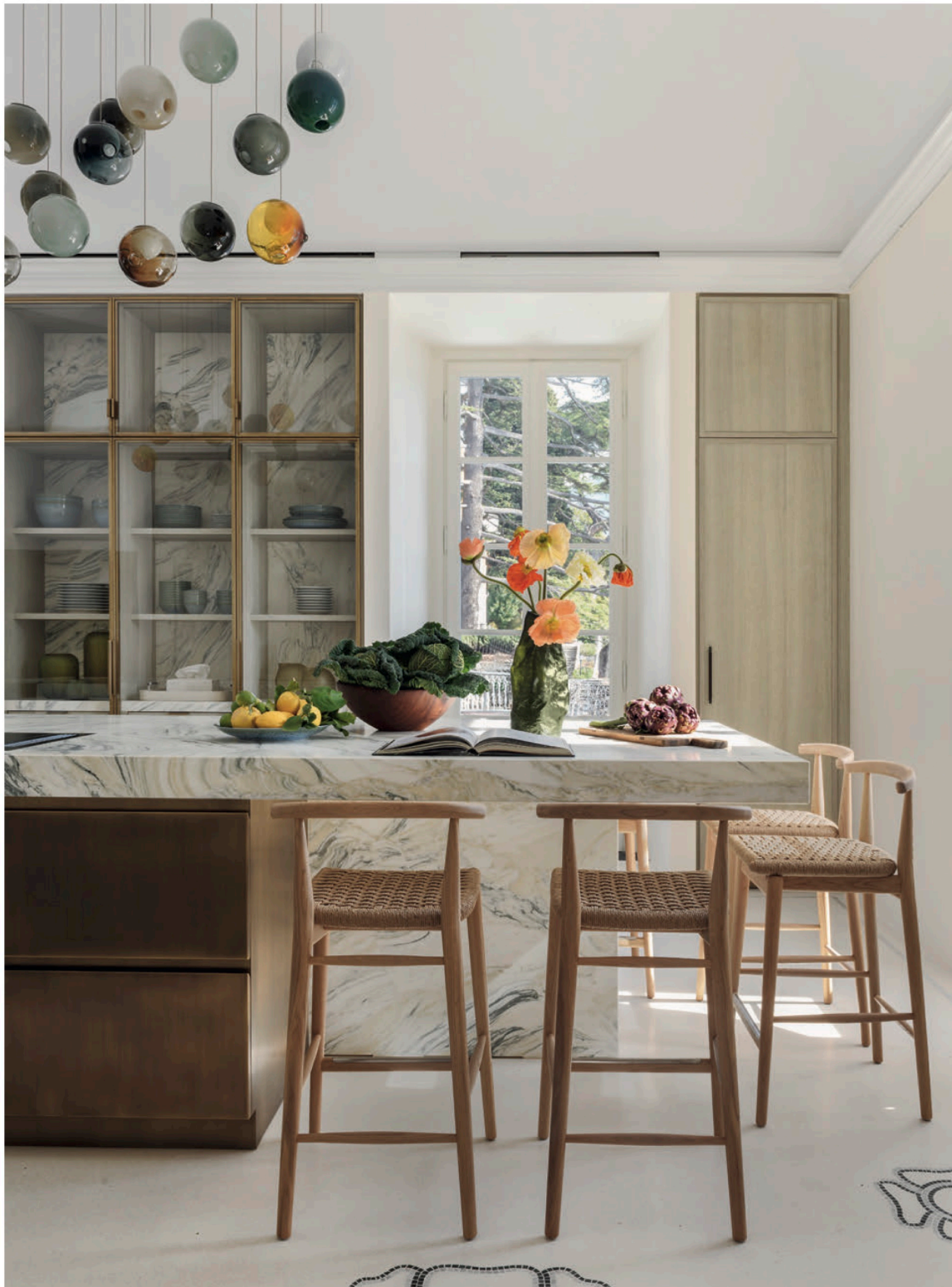
Les armoires de la cuisine ont été conçues sur mesure par Ina Rinderknecht avec du bois coloré de Schotten & Hansen , tout comme l'îlot en marbre Calcatta Arni . Un nouveau sol en terrazzo est orné de fleurs décoratives, emblèmes du lieu. Lustre 28.28 de Bocci . Tabourets de bar JENS , Antonio Citterio , B&B Italia .