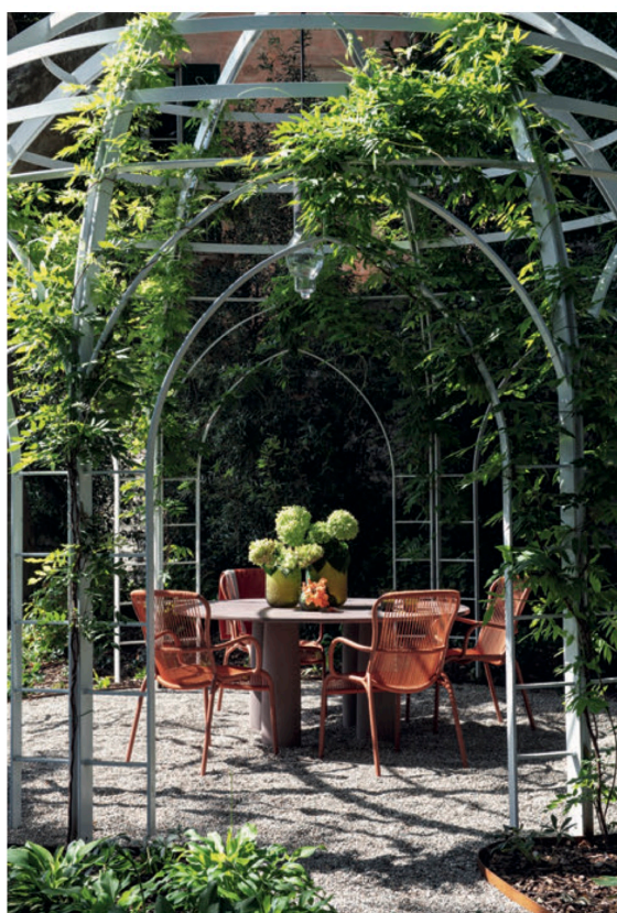
Table à manger IL COLONNATO MINERA STONE de Kettal et chaises LOOP de Vincent Sheppard . Vases BAMBOLA, Guaxs .

Dans la cuisine extérieure, les tabourets de bar ROLL de Patricia Urquiola , Kettal entourent un îlot fabriqué en marbre Breccia Pernice. Suspension JANE , Xal .