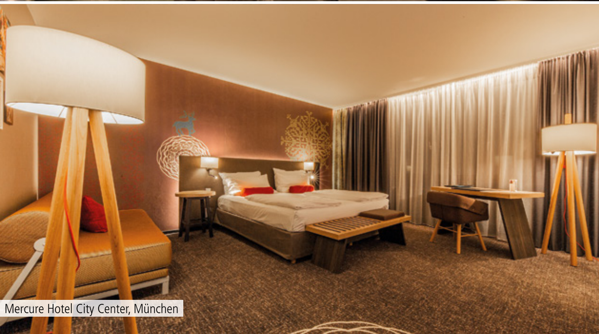
Mercure Hotel City Center, München