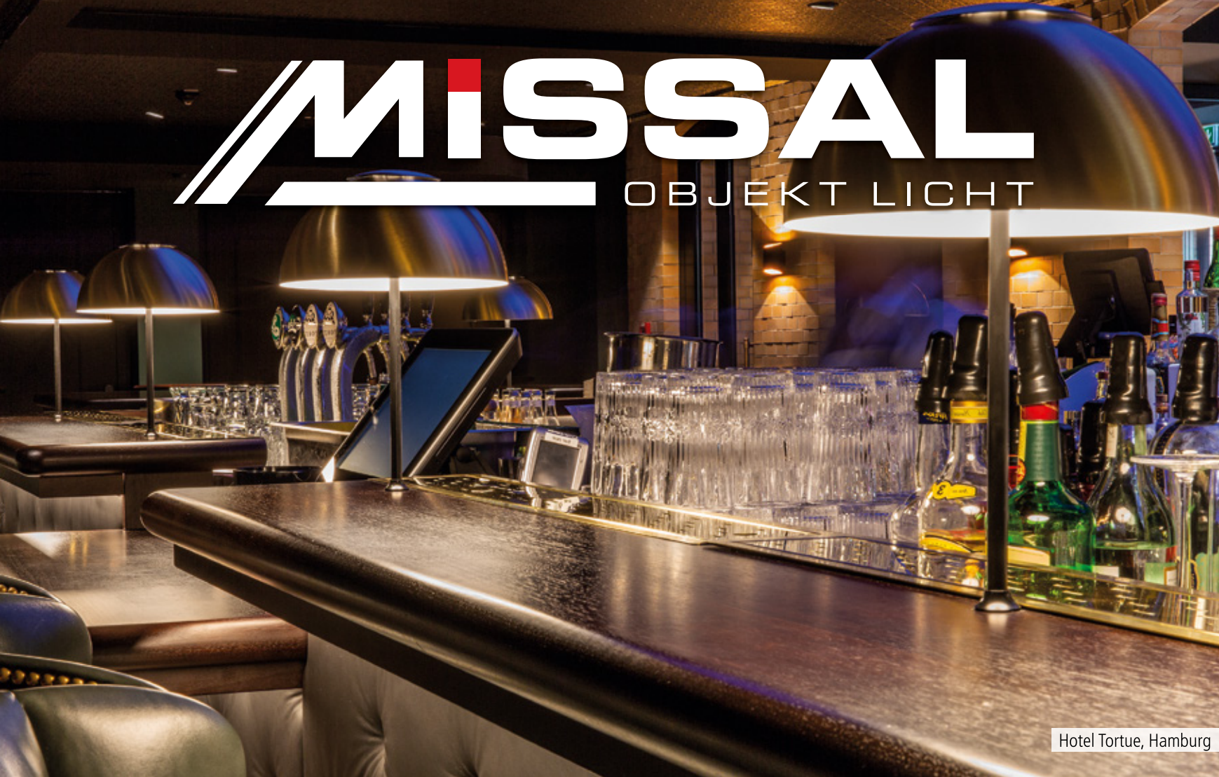
Hotel Tortue, Hamburg