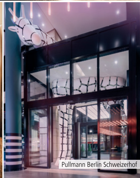
Pullmann Berlin Schweizerhof

Wir sind Ihr Partner für objektspezifische Sonderanfertigungen von dekorativen und technischen Leuchten.