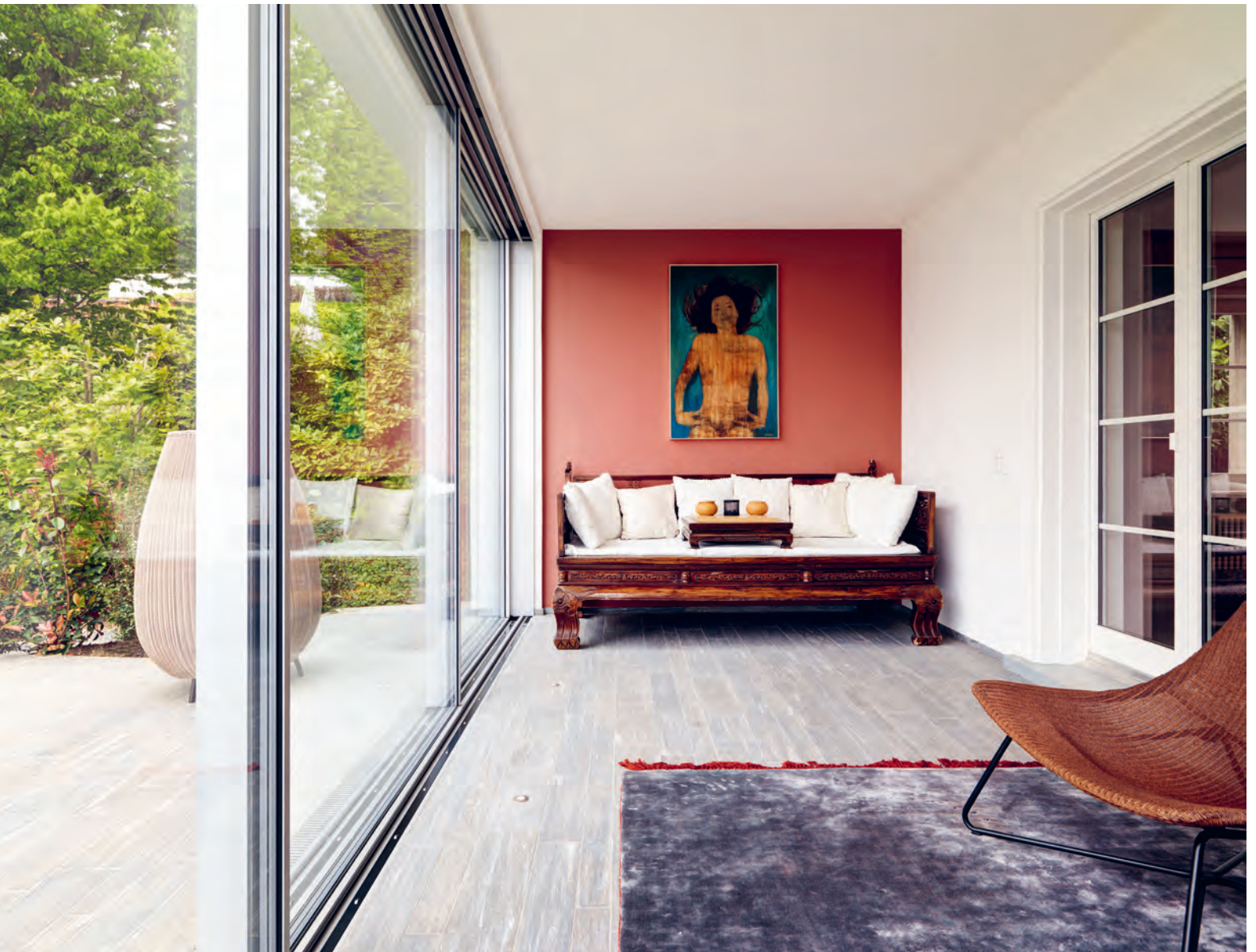
Oben Ein altes chinesisches Sofa sowie ein Bild zeugen noch vom ehemaligen Wohnort der Bauherren: Shanghai. Der Wintergarten ist dem Wohnraum vorgelagert und mit grossen Schiebefenstern ausgestattet.